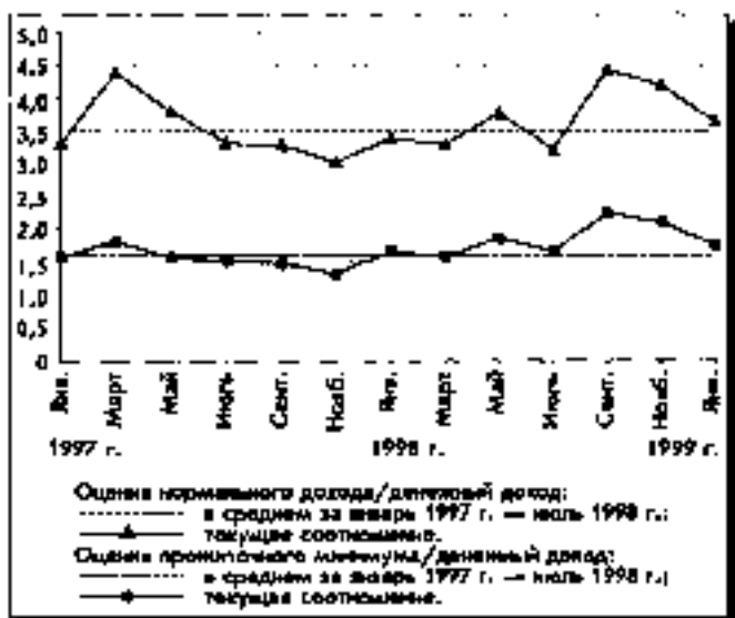
Рис. 5. Соотношение величины оценок нормального дохода и прожиточного минимума с денежными доходами населения (по данным рис. 3; денежные доходы — по данным ВЦИОМ)

правительства В.Черномырдина, ясно видно на рис. 6. Этот же рисунок хорошо иллюстрирует динамику роста доверия правительству Е.Примакова.