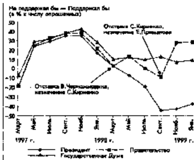
Рис. 6. Отношение к Президенту, Правительству и Государственной Думе (Мониторинг ВЦИОМ. Вопрос: "Лично Вы поддержали бы выступления протеста с требованиями отставки Президента, отставки Правительства, роспуска Государственной Думы?")

Основу столь нехарактерно высокого для современной России уровня общественного доверия правительству, скорее всего составляет укрепившаяся в массовом сознании ассоциация фигуры Е.Примакова и его кабинета с на-